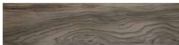
ESS. Kate Grey 25x100