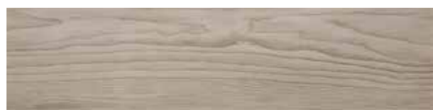
ESS. Kate Pino 25x100